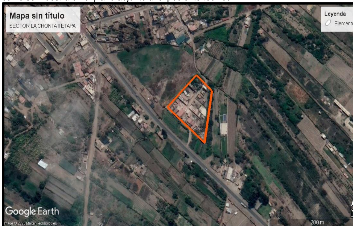
Vista en planta del tramo a intervenir (Zona del proyecto)

El área de influencia del proyecto está enmarcada todo el Anexo Sector de Chonta, tal como se muestra en el plano adjunto al expediente técnico.