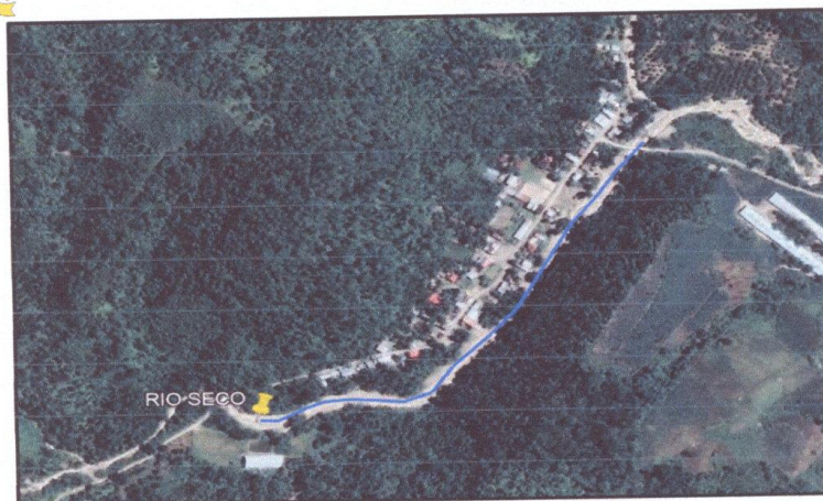
CROQUIS DEL TRAMO A INTERVENIR