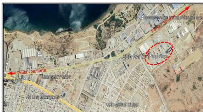
Plano de ubicación de ZED PAITA