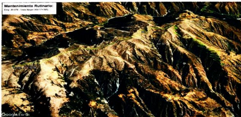
Imagen satelital google heart, de la ubicacion del tramo