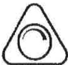
Figura: Regulación Permitida