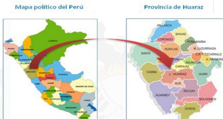
Imagen N°02: Distrito de Huaraz