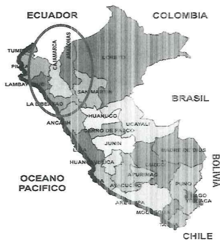
Ilustración 1: Mapa de Macro localización