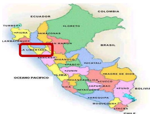
- Figura N° 01: Ubicación del departamento La Libertad dentro del mapa del Perú.