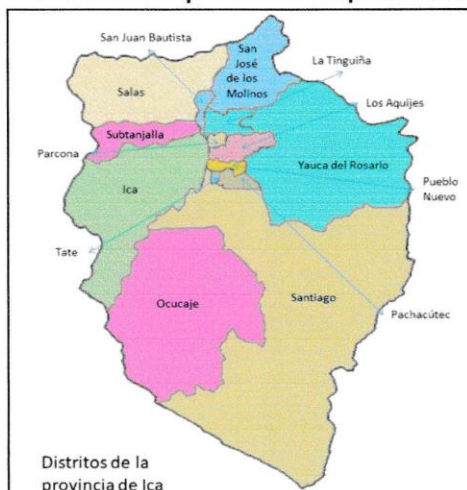
Ilustración 1: Mapa Político del Departamento de Ica