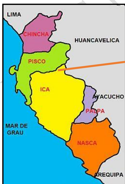
IMAGEN N°02 UBICACIÓN PROVINCIAL