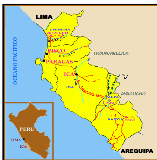
IMAGEN N°01 UBICACIÓN DE LA REGIÓN ICA EN EL PERÚ