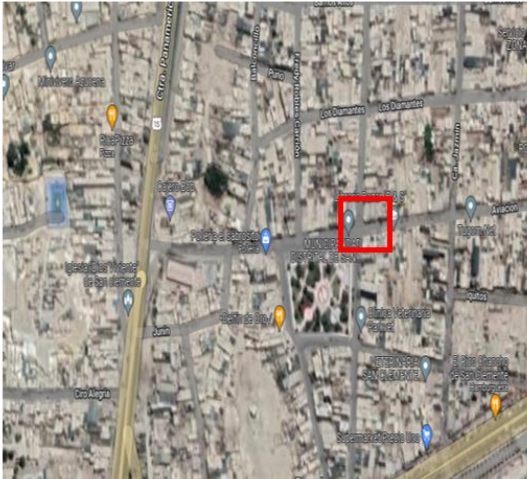
UBICACIÓN SATELITAL DE LA MUNICIPALIDAD DISTRITAL DE SAN CLEMENTE