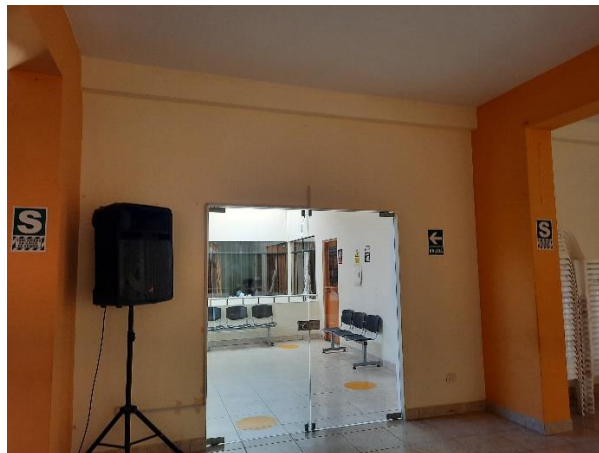
IMÁGENES DE AMBIENTES EN EL SEGUNDO PISCO

El área donde se realizarán la remodelación de los ambientes de la Municipalidad Distrital de San Clemente en el primer y segundo piso.