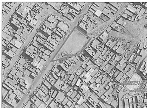
Imagen 1: Ubicación del proyecto en el Distrito de San Juan de Lurigancho.