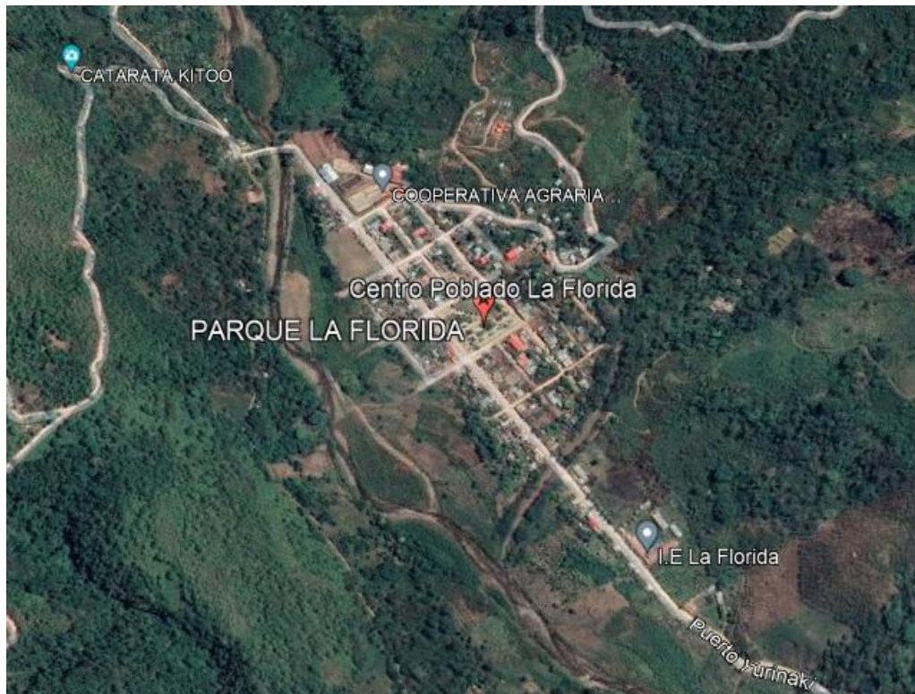
Ubicación de la Zona de Intervención – Localidad de la Florida