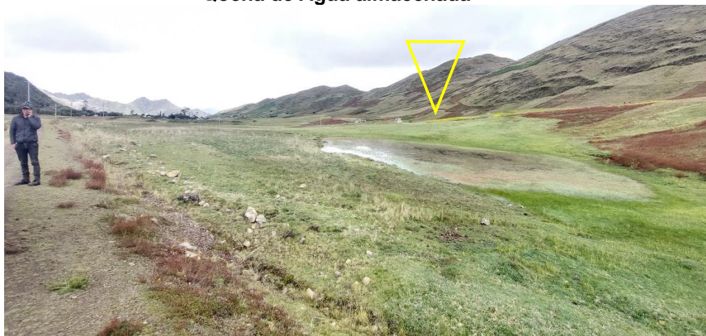
FOTO No 02 Qocha de Agua almacenada