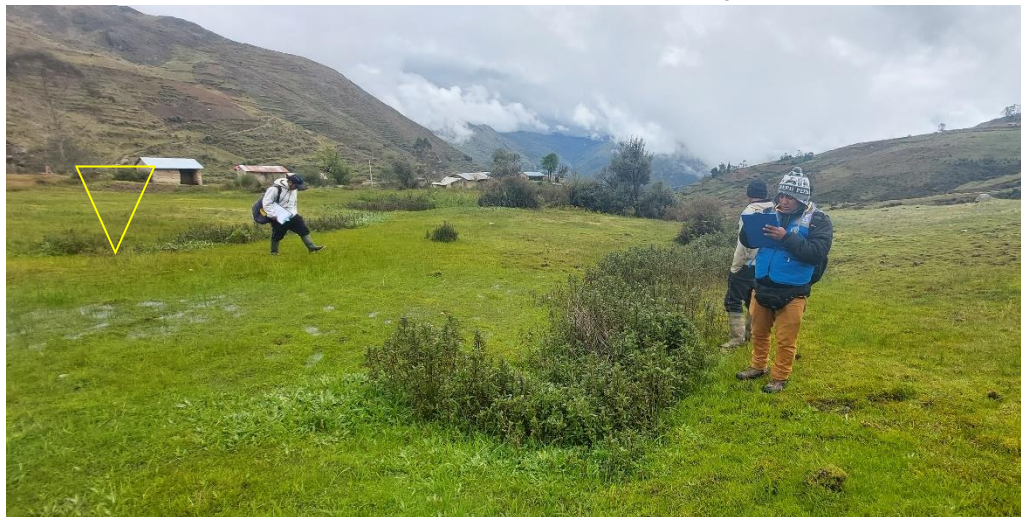
Qocha de la Localidad de Huamally