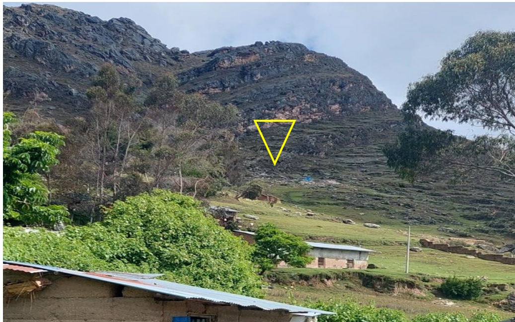
FOTO No 02 Manantial en la Localidad de Huanchan

En la Localidad de Huanchan cuentan con Manantes la cual, es apto para siembra y cosecha de agua tal como se observa en la fotografía anterior, ya que en el mismo lugar cuentan de ojo de agua.