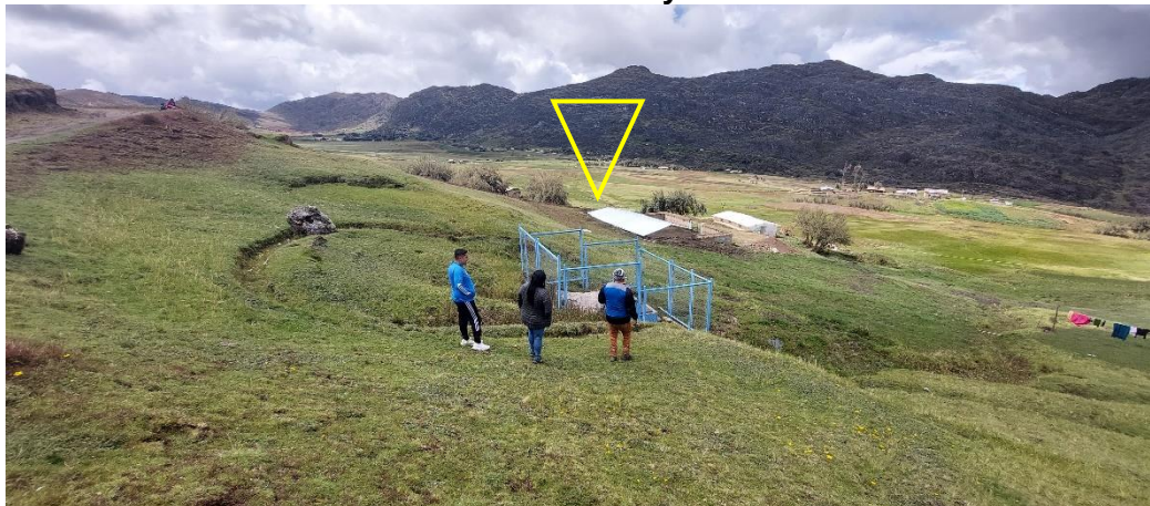
FOTO No 02 Manantial en la Localidad de Rayancancha