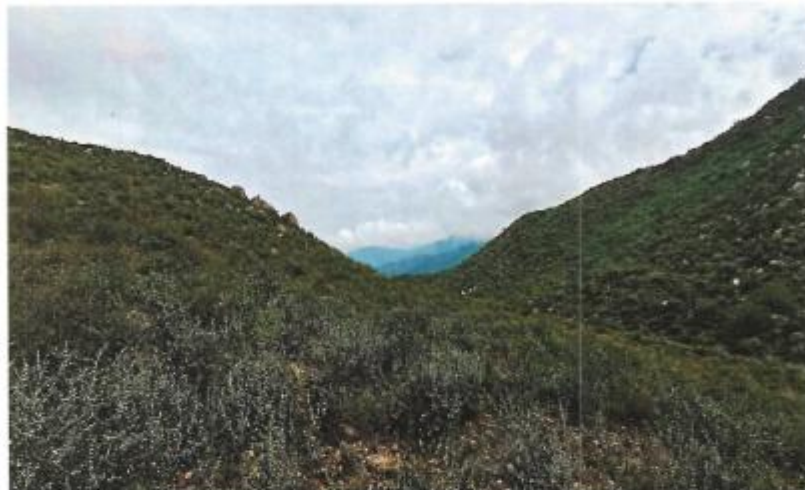
GRAFICO N°02: Vista Panorámica de la cuenca en el área de intervención

"AÑO DE LA RECUPERACIÓN Y CONSOLIDACIÓN DE LA ECONOMÍA PERUANA"