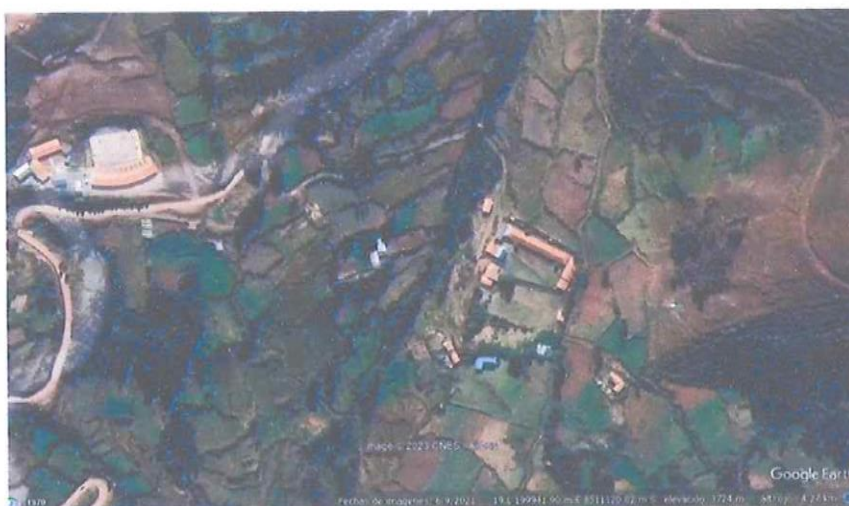
FIGURA N°01: Localización geográfica del proyecto