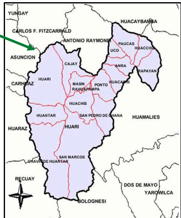
Provincia de Huarí

Las características y ubicación del tramo de la vía a intervenir se muestran a continuación: