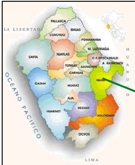
Departamento de Ancash