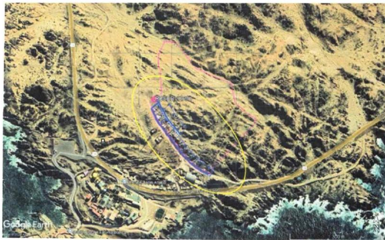
UBICACIÓN DEL ÁREA DEL PROYECTO

El proyecto se encuentra ubicado en el distrito de Atico, a una altitud promedio de 47 m.s.n.m., la distancia promedio desde el centro del distrito hasta el área del proyecto es de 10 klm en promedio, se llega en un tiempo estimado de 25 minutos, la vía se encuentra asfaltada hasta cierto tramo luego se continúa por una pequeña zona de trocha carrozable hasta el lugar del proyecto