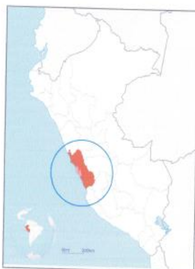
GRÁFICO *01. Localización de la inversión.