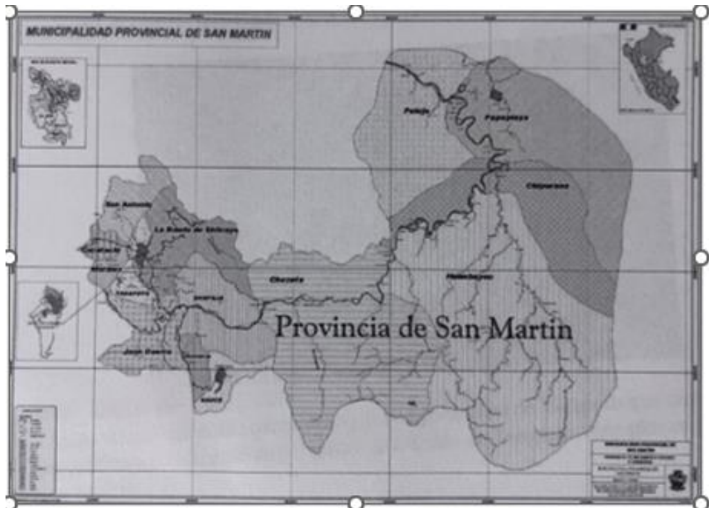
GRÁFICO N°03: MAPA DE UBICACIÓN DEL DISTRITO DE TARAPOTO.