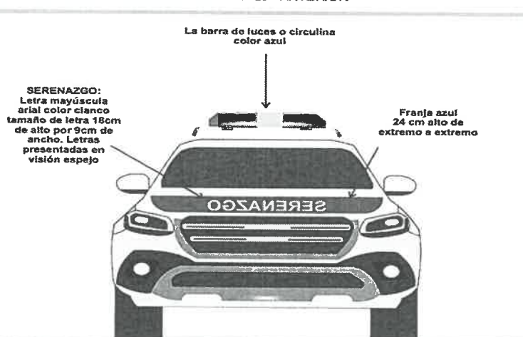
GRÁFICO N° 20 - ANTERIOR

SE ADJUNTA GRAFICO N°20,21,22. PARA DAR ESTRICTO CUMPLIMIENTO A LO SEÑALADO.