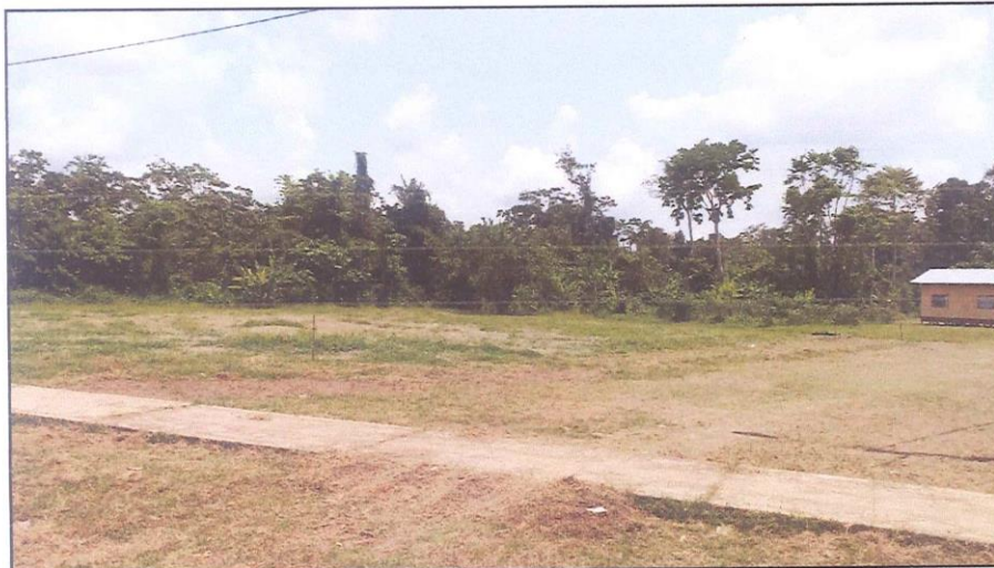
FOTO N° 02: VISTA DEL TERRENO ASIGNADO COMO LOCACIÓN DEL POZO TUBULAR

Se construirá una caseta de válvulas de albañilería y una caseta de bombeo de concreto armado para la protección y seguridad de la bomba, equipos y árbol hidráulico.