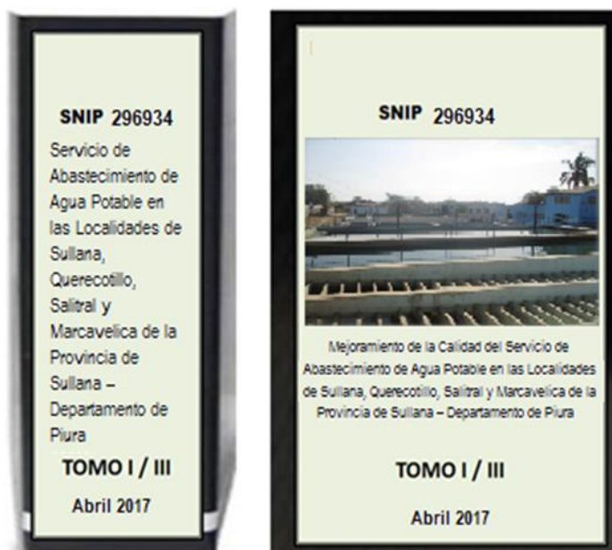
Ilustración 1: Modelo de Presentación del Expediente Técnico