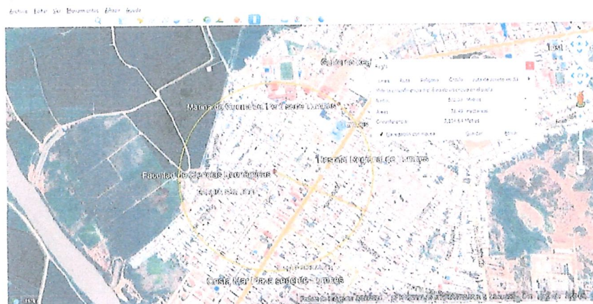
Imagen N° 01.- Imagen de referencia para ubicación de locales para atención del servicio alimentario para la Facultad de Ciencias Económicas.