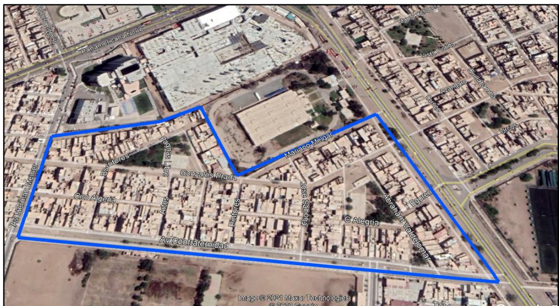
Gráfico N°1 – ZONAS A INTERVENIR

Nombre del PIP o inversión "MEJORAMIENTO DEL SERVICIO DE TRANSITABILIDAD VEHICULAR Y PEATONAL EN EL PUEBLO JOVEN RICARDO PALMA DISTRITO DE CHICLAYO - PROVINCIA DE CHICLAYO – DEPARTAMENTO DE LAMBAYEQUE" con código Único N° 2471247