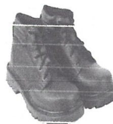
Zapato de seguridad Puntera Acero