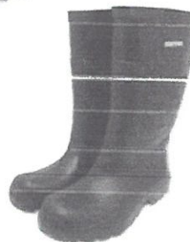
Bota de Jebe

Equipos de Protección Personal (EPPs) los cuales deberán ser reemplazados de acuerdo a la necesidad. En el caso de los cascos de protección estos deben cumplir con los requisitos de absorción de impacto y resistencia a la penetración el personal de mantenimiento deberá usar cascos de color anaranjado, mientras que de los jefes de mantenimiento deberá ser color azul.