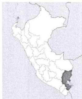
Ilustración 6: Mapa macro de la localización del Perú