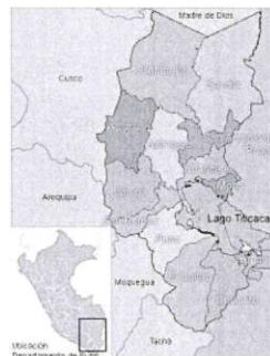
Ilustración 7: Mapa del departamento de Puno