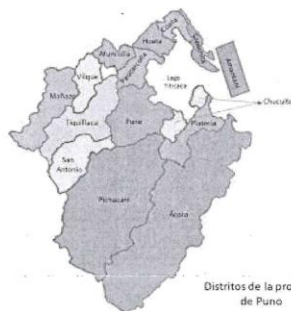
Ilustración 8: Mapa del distrito de Puno