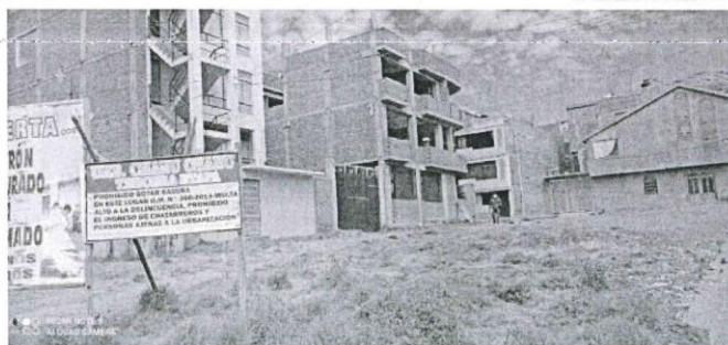
Ilustración 11: Foto tomada desde intersección de Av. Residencial y Calle S/N

Ademas se ha destinado un espacio para el ejercicio al aire libre, incentivando la practica de ejercicio en los jovenes del lugar y propiciando los distintos usos en el espacio de recreacion, dando oportunidad a la integracion de jovenes y pequeños.