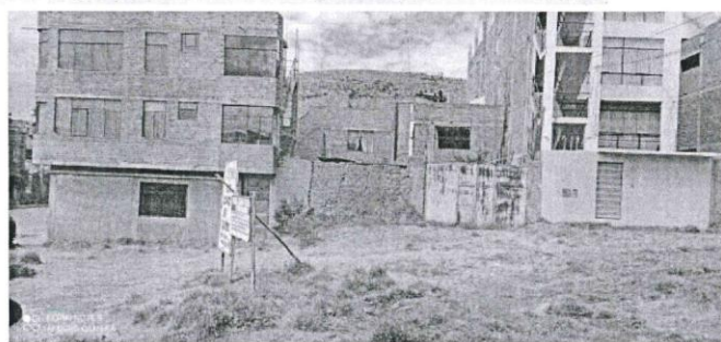
Ilustración 10: Foto tomada desde Calle S/N