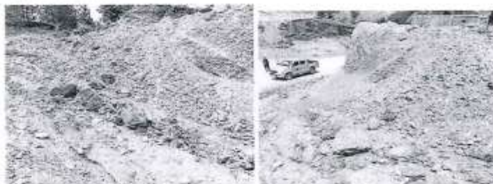
SIN ACCESO VEHICULAR