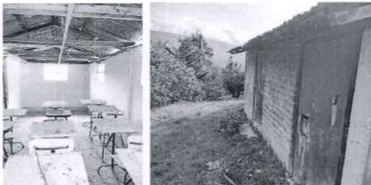
MUROS EXTERIORES SIN TARRAJEAR, PUERTAS EN MAL ESTADO, MOBILIARIO DETERIORADO

- Además, existe otras necesidades, que son importantes para que se desarrolle un adecuado aprendizaje: