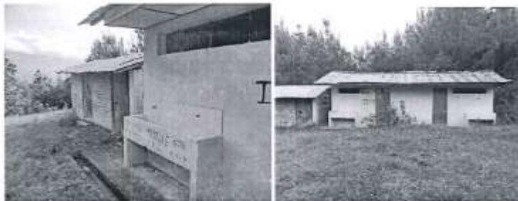
VISTA PANORAMICA DE LOS AMBIENTES A MEJORAR

- Ambiente destinado a educación – ambiente 01: Este ambiente cuenta con las siguientes características: