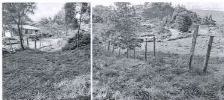
SIN ACCESO PEATONAL ADECUADO Y CERCO EN MAL ESTADO