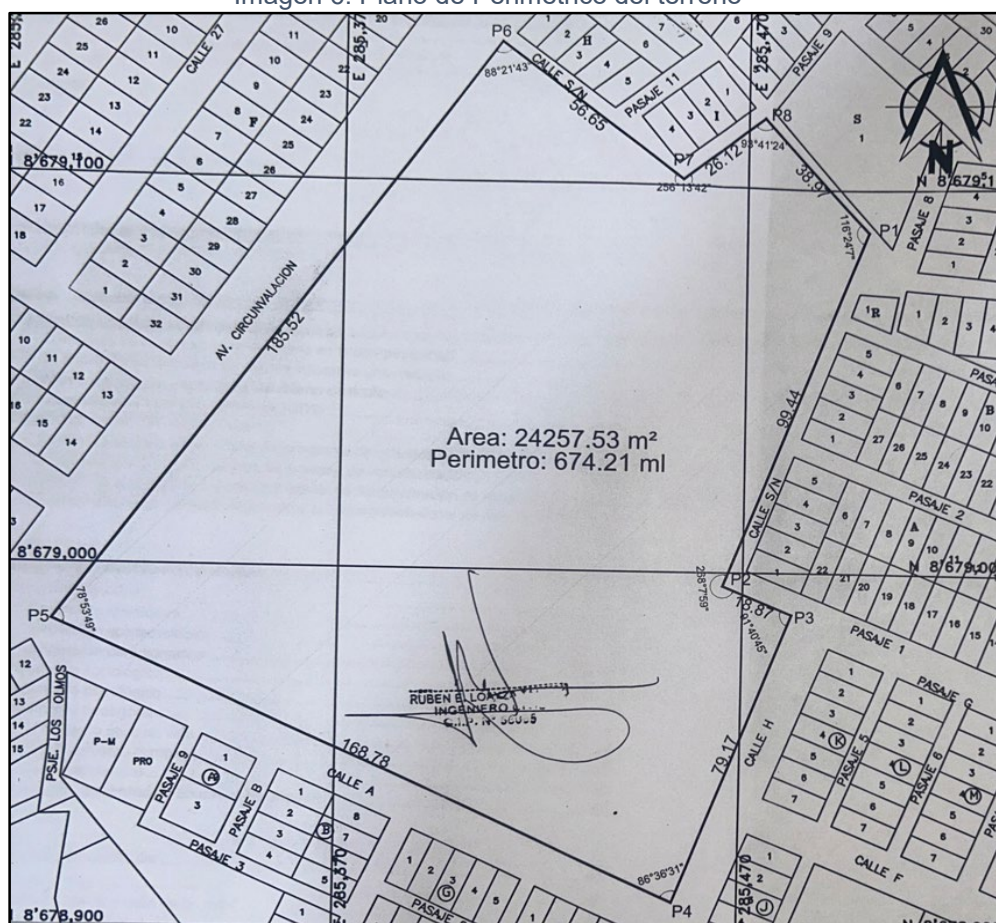
Imagen 6: Plano de Perimétrico del terreno