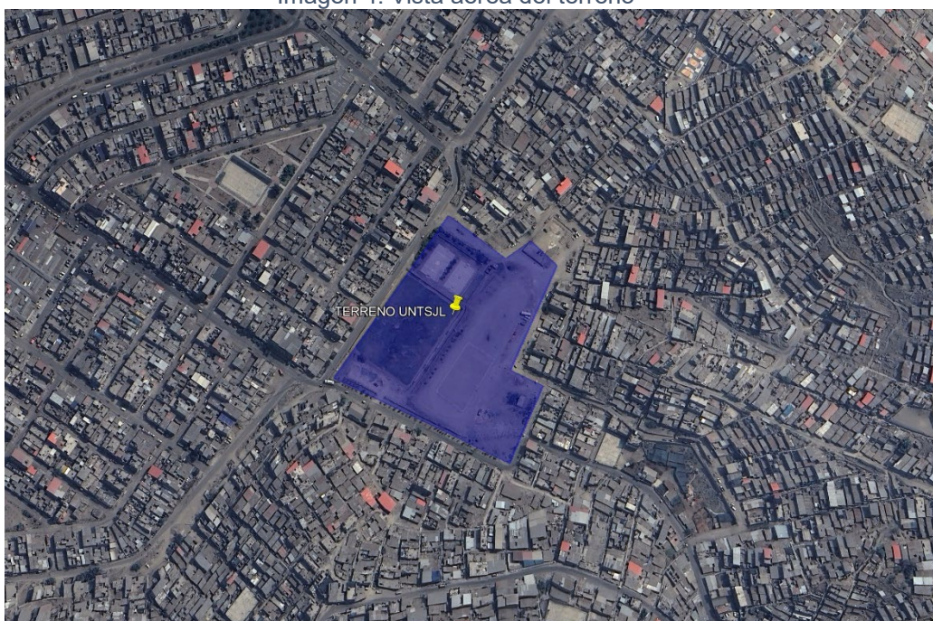
Imagen 4: Vista aérea del terreno