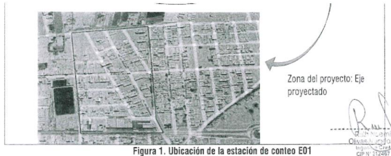
Figura 1. Ubicación de la estación de conteo E01