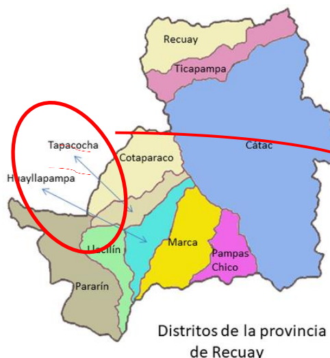
Distritos de la provincia de Recuay