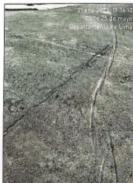
Imagen N°02 Y N°03 – Estado actual de la calle 25 de mayo