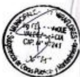
Calle Costa Rica