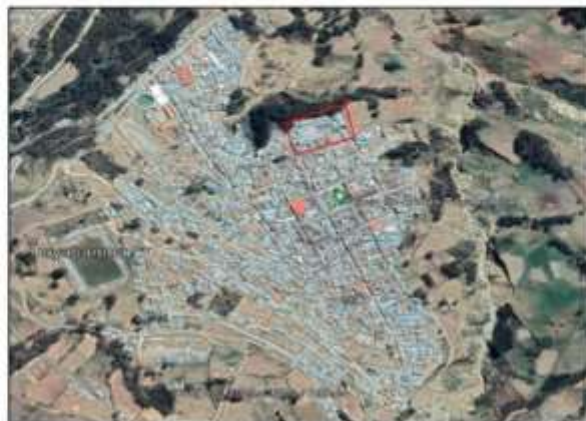
Ilustración 1- Plano Topográfico