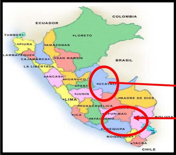
Ilustración 1: Croquis de ubicación del departamento de Ucayali en el Perú