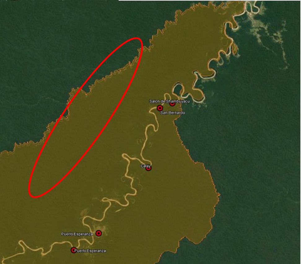
Ilustración 3: Localidades de Puerto Esperanza y Shalom de Shambuyacu