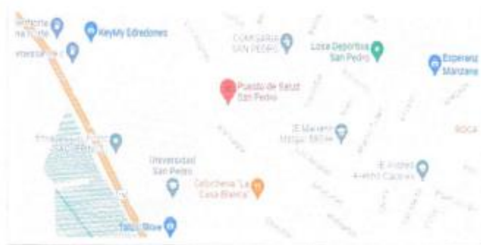
Plano de Ubicación Geolocalización