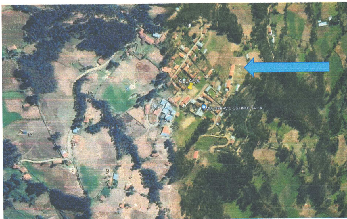
Ubicación Geográfica del lugar donde se proyecta la edificación.

Imagen N° 1: Ubicación y localización (9'102,465.00 N, 219,110.00 E)