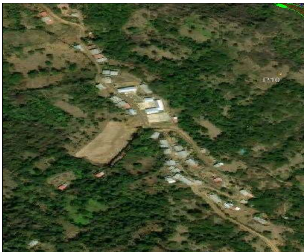
IMAGEN N° 01: LOCALIDAD DE TAYAPITE.

Región : Piura Provincia : Huancabamba Distrito : Huarmaca Localidad : Tayapite - Payturan