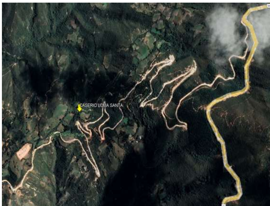
IMAGEN N° 01: LOCALIDAD DE LOMA SANTA.

La vía utilizada con la capital del departamento de Piura, es como sigue: