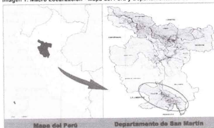
Imagen 1: Macro Localización - Mapa del Perú y Departamental de San Martín