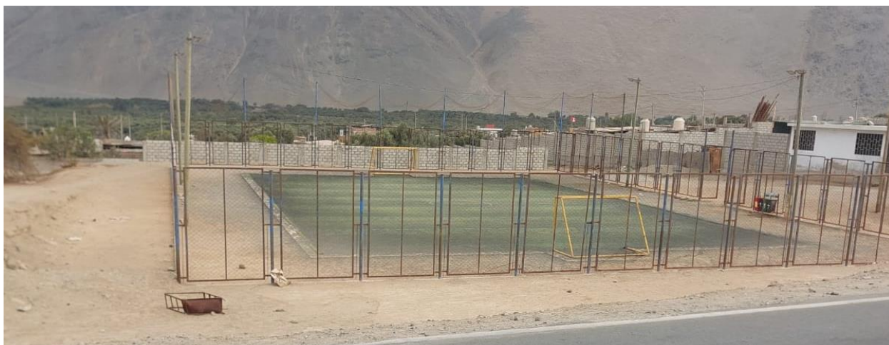
Grafico : Vista de losa existente a intervenir

El proyecto se localizará en el la Losa Deportiva Cerro de Pasco Ubicado en el AA.HH. El Porvenir ya que tiene acceso a los servicios básicos como agua, electrificación y con accesos de vías de comunicación establecidas.