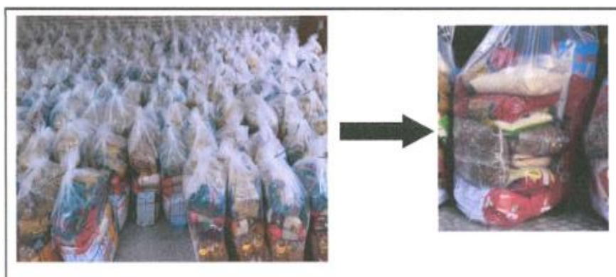
IMAGEN REFERENCIAL DE LA PRESENTACION DE LOS KIT DE ALIMENTOS