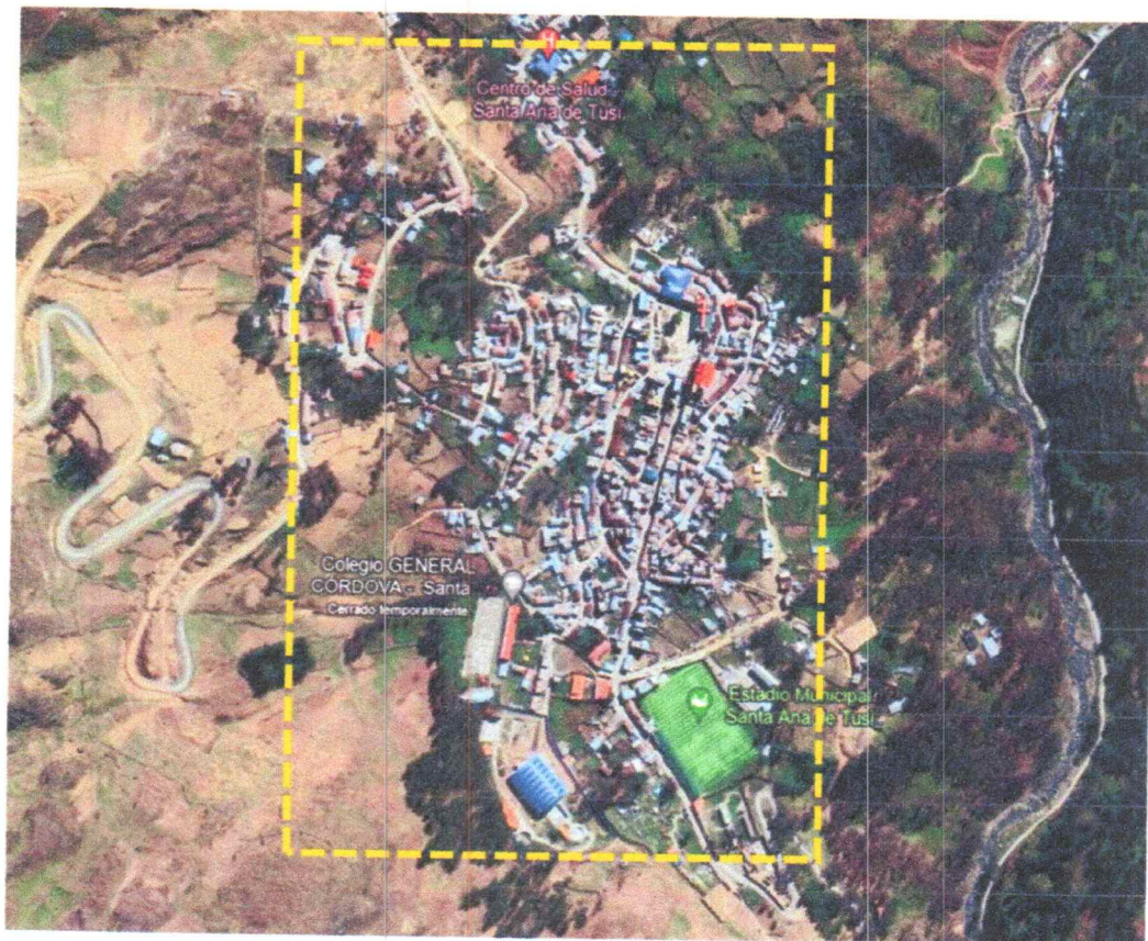
FIGURA N° 2 UBICACIÓN GEOGRÁFICA DEL PROYECTO

El presente Proyecto a ejecutarse se encuentra en el Distrito de Santa Ana de Tusi, está ubicada en una altitud aproximada de 3760.00 msnm. El Distrito de Santa Ana de Tusi es uno de los distritos que conforman la provincia de Daniel Alcides Carrión, perteneciente a la Región Pasco.