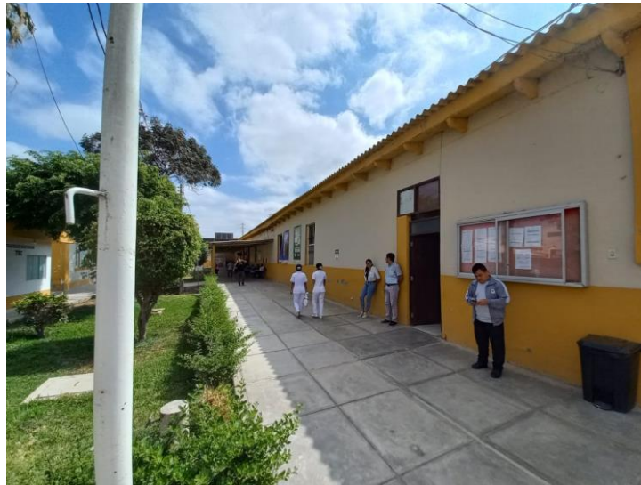
Foto 1: Exterior de pabellón Santa Ana (oficinas Administrativas).

La ubicación de la infraestructura será en un área que inicialmente no cuenta las condiciones mínimas dentro de un ambiente hospitalario, por ende, se contará con las remociones y demoliciones necesarias para reutilizar el área seleccionada.