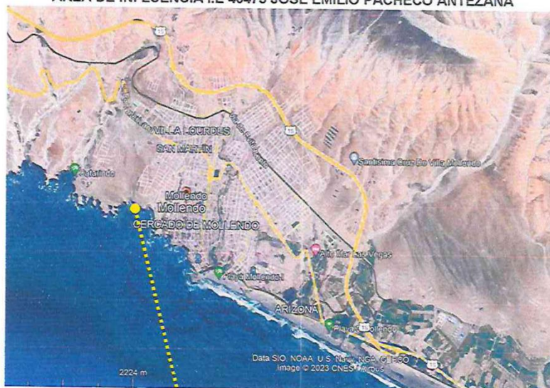
IMAGEN N° 03 ÁREA DE INFLUENCIA I.E 40473 JOSÉ EMILIO PACHECO ANTEZANA