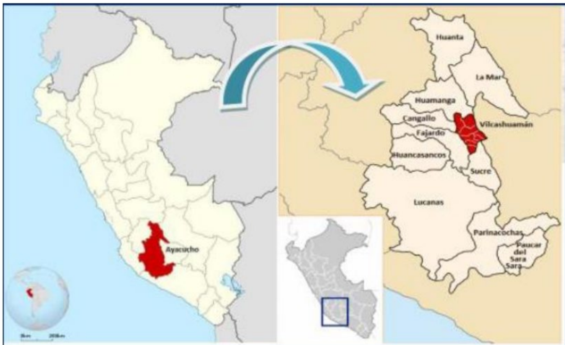
Figura 4-1 Localización Departamental y Provincial

Imagen N°02 Ubicación del Proyecto en el distrito de Huambalpa