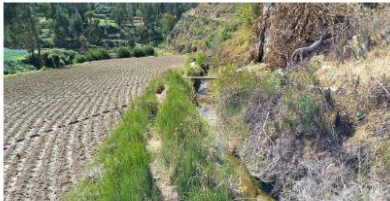
Estado actual del canal