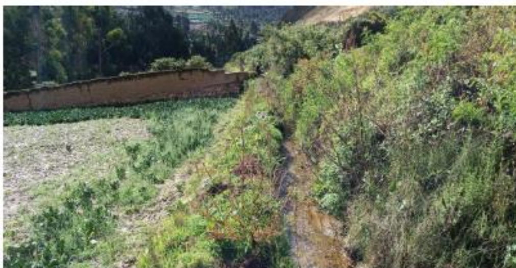
Estado actual del canal