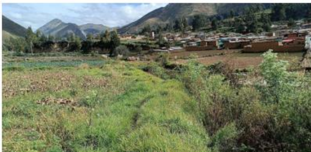
Estado actual del canal