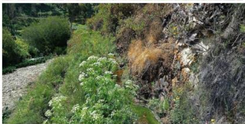
Estado actual del canal