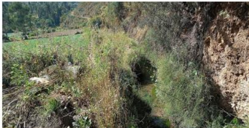
Estado actual del canal