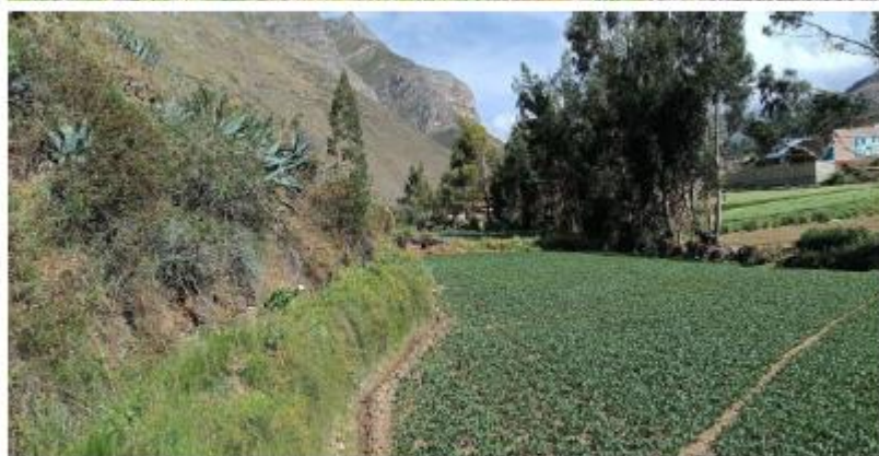
Estado actual del canal