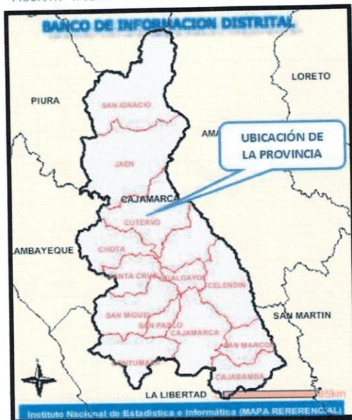
FIGURA N° 2: UBICACIÓN GEOGRÁFICA: DISTRITO DE CUTERVO