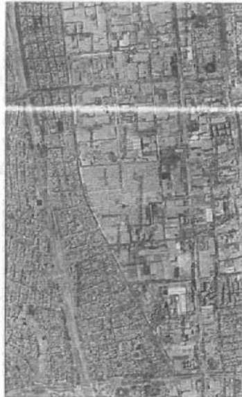
Gráfico N°01: Ubicación Geográfica del Proyecto

El AAHH Villa Señor de los Milagros es parte del Distrito de Carmen de la Legua Reynoso, Provincia Constitucional del Callao, el Distrito cuenta con una superficie de 2.12 Km2; se localiza en la parte Nor-Este del Callao, Región Callao – Perú, limita por el Norte con una línea imaginaria que sigue el límite provincial, a partir del hito calle Rímac Surco hasta el hito Rímac Sur, de ese punto continúa la línea hacia el oeste por la Av. Elmer Faucett, con el Distrito de San Martín de Porres, por el Este siguiendo el límite provincial, a partir del Hito Argentina norte hasta el hito Calle Rímac, avenida Argentina Km 5.5 hasta el hito calle Rímac con el Cercado de Lima, por el Sur continúa la línea del cruce de las avenidas Argentina y Faucett, km 4.6 con el Distrito de Bellavista, y por el oeste con el Distrito del Callao.