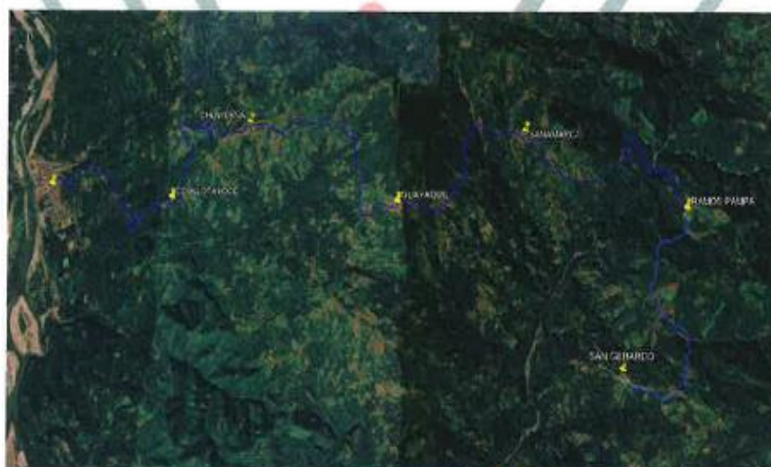
Plano de ubicación Local