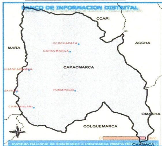
figura 1 ubicación del proyecto