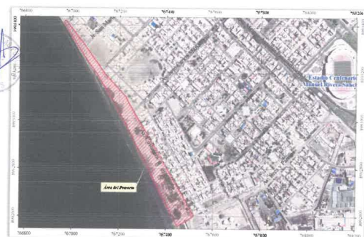
Imagen N°02.- Vista Satelital del área del Proyecto.