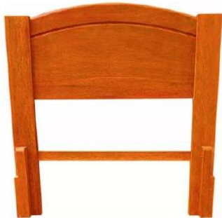
VISTA GENERAL REFERENCIAL